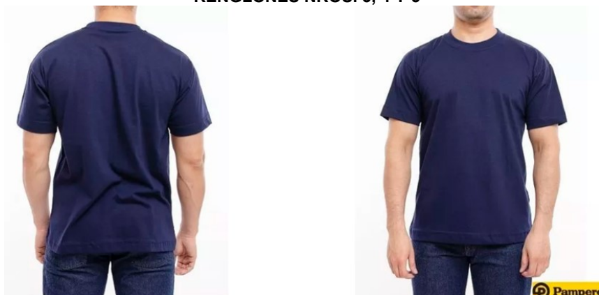
RENGLONES NROS. 3, 4 Y 5

IMÁGENES ILUSTRATIVAS: Las mismas son de referencia para tomar conocimiento de dónde irían ubicados los logos. Si los colores/características difieren de las descripciones, se deberá respetar lo que figura en la descripción de cada renglón.