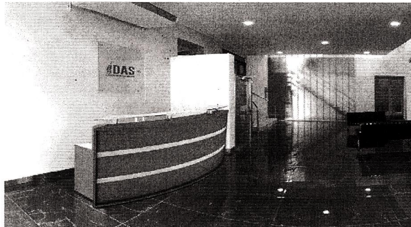
Renglón N° 2