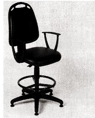
Renglón N° 3